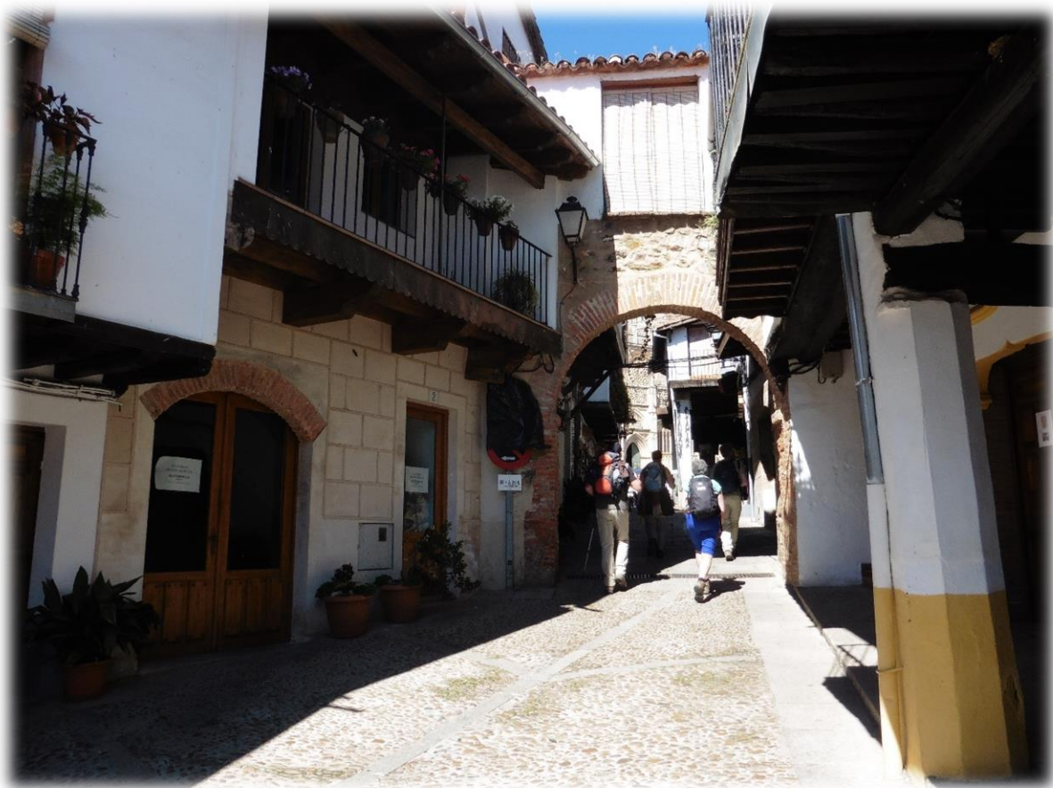
Christoffel Columbus was hier in de Semana Santa van 1486 aan het hof van de Reyes Católicos met het doel het koningspaar te overtuigen om zijn reis naar Indië te financieren.